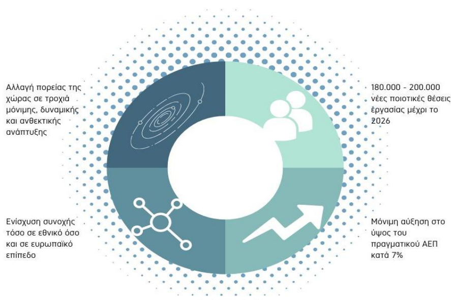
Εικόνα 3 Οφέλη του Εθνικού Σχεδίου Ανάκαμψης και Ανθεκτικότητας – «Ελλάδα 2.0» (Πηγή: https://greece20.gov.gr/ ) - Επεξεργασία συμβούλου

Ενώ, τα οφέλη που αναμένονται να υπάρξουν από την επιτυχή υλοποίηση του σχεδίου «Ελλάδα 2.0» απεικονίζονται στο παρακάτω σχήμα (Σχήμα 2).